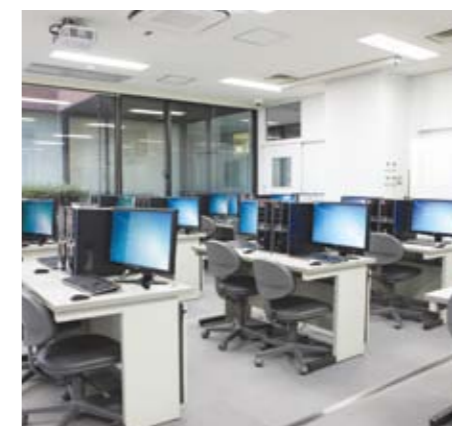
クリエイティブ工房/Creative studio