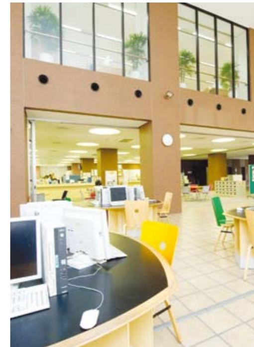
キャンパスセンター/Campus center