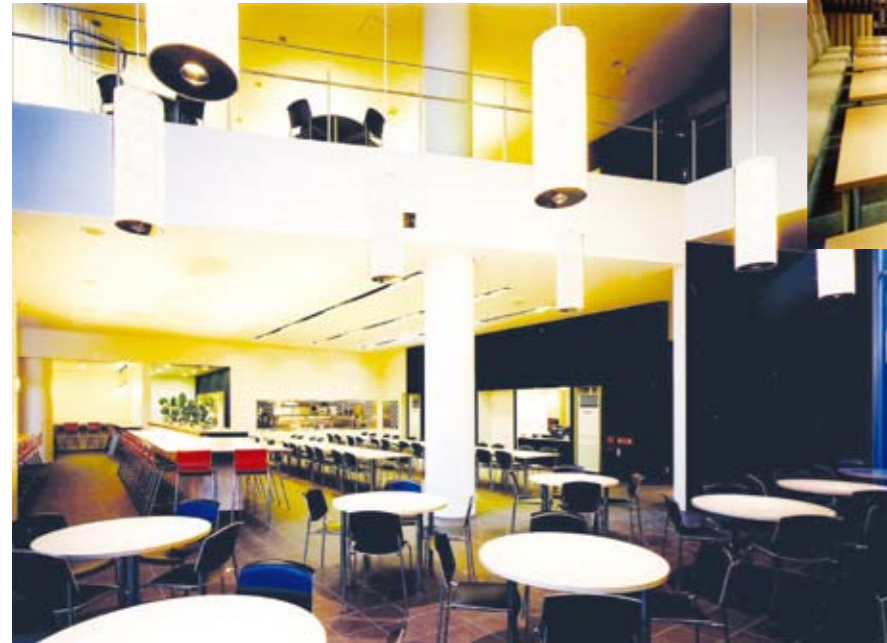
学生食堂/Student dining hall

カフェ感覚でゆっくり過ごせる スタイリッシュなキャンパス食堂 A stylish campus dining room that's like a cafe