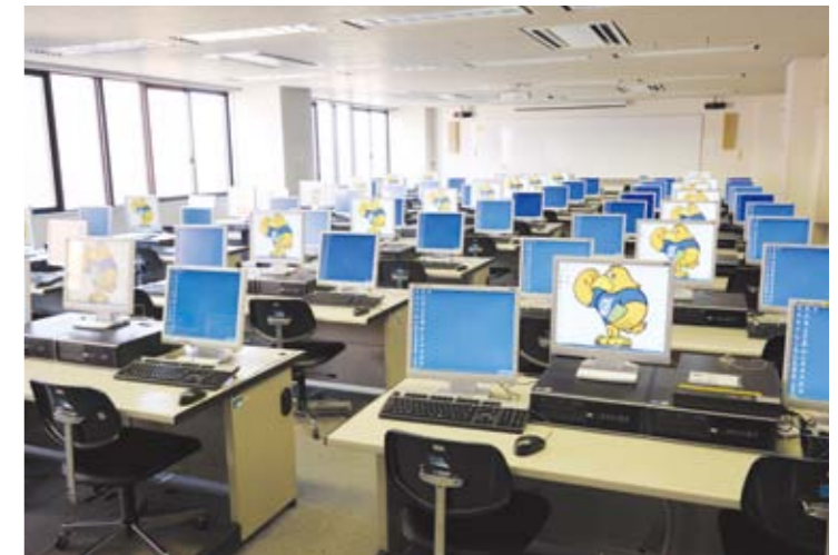
コンピュータ演習室/Computer exercise rooms