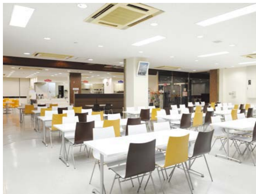
学生食堂/Student dining hall

Surrounded by greenery, the Hirakata Campus is in a more rural setting in the suburbs. Comfortable yet relaxed environment for studies.