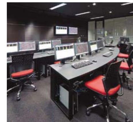
バーチャリトレーディングルーム/Virtual trading room