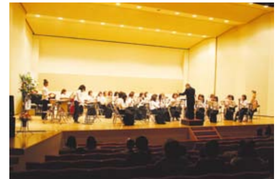
興田メモリアルホール/Okuda Memorial Hall