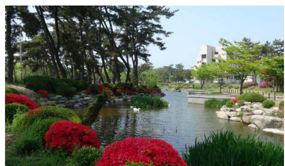
시민들의 휴식공간으로 사랑받는 황룡호수

PE프로그램은 네트워크 상 가상기업 간의 기업경영실습 프로그램으로 제품과 재화만을 가상으로 설정하고 설립에서부터 경영에 이르는 비즈니스과정은 실제 기업과의 교류를 통해 업무환경, 조직도, 기본 업무 프레임이 그대로 실현하는 훈련용 기업이다. 인문대학과 사회대학의 현장실습 대안 프로그램이다. 현장실습 기회가 적은 인문사회과학 분야 학생들에게도 현장실습의 기회를 제공하며 많은 도움을 주고 있다. 세계 각국에 퍼져있는 실습기업들과의 가상 거래를 통해 가상 현장실무능력을 제고할 수 있어 글로벌 역량도 강화할 수 있다. 군산대가 운영하는 프로그램에는 아모레퍼시픽, 인텔코리아, 우양방동식품 등 10여개 회사가 참여하였다.