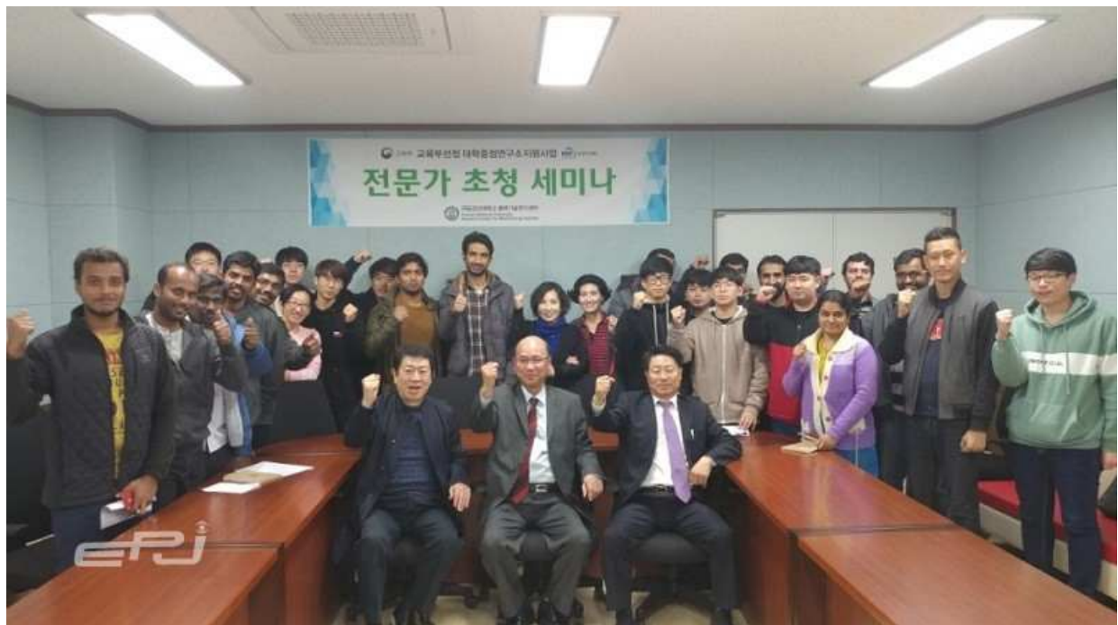
▲ 군산대학교 풍력기술연구센터에서 실시한 전문가 초청 세미나.

이어 “신재생에너지 REC의 가중치를 기상 및 기후·풍력발전의 특성, 설치 유형 및 용량 등을 고려해 산정하고 최종적으로 풍력산업의 수익 기준표를 수립해 사업의 불확실성으로 인해 사업지연현상을 줄이도록 노력해야 한다”고 말했다.