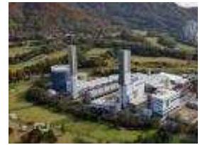
도심 속 분산전원 위례열병합발전, 에 '톡톡'