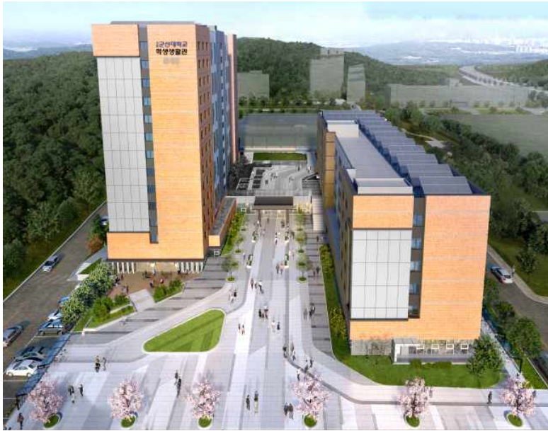
< 2024년 2월 예정 >