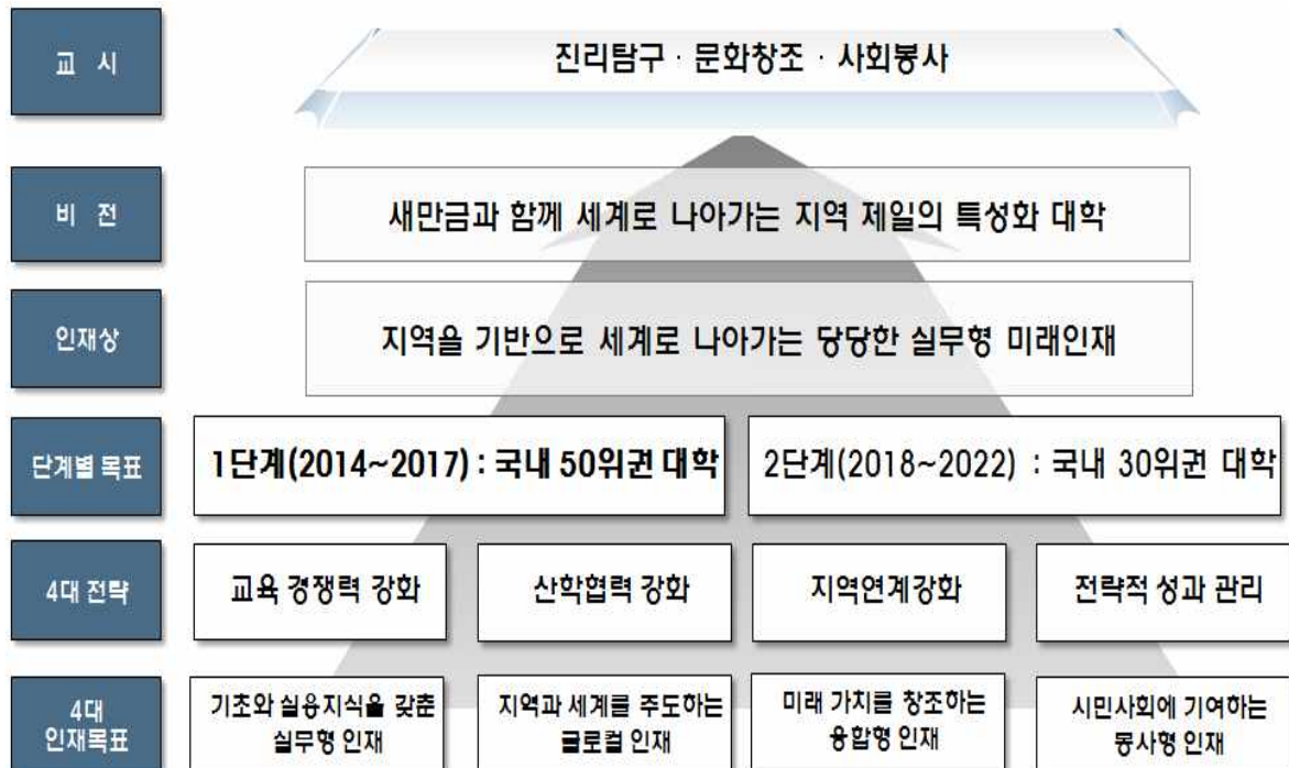
<그림 1-3> 군산대학교 비전 전략체계도