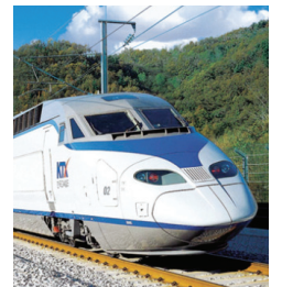
KTX 호남고속철도 2-3공구

건 설 : 총 68개 현장 휴게시설 : 총 8개 사업장(휴게소 4개, 주유소 4개)