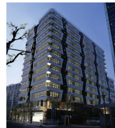
문래동 하우스비즈 (지식산업센터)