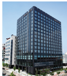
신라스테이 천안 호텔