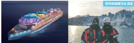
세계 최대 미국 크루즈선사 Royal Caribbean 항해사 승선