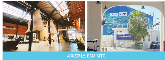
사이프러스 BSM MTC

해외교육 | '18:아보아마레(핀란드) '19:아보아마레(핀란드), 노르웨이 NTC(필리핀) 추진경과 | '20: 코로나팬데믹으로 전 과정 국내교육 '21:아보아마레(핀란드) '22-23:BSM MTC(유럽 사이프러스)