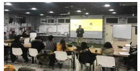
<청춘당 활용 외부 세미나 교육>