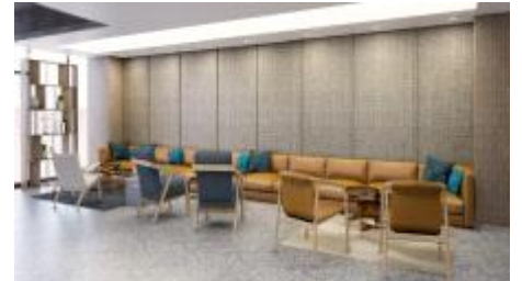
<리빙랩 내 소통공간>