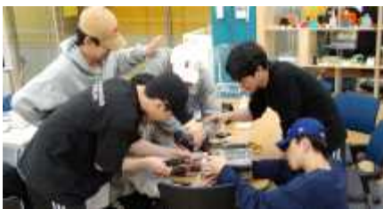
<디자인 팩토리 공간을 활용한 작업공간>