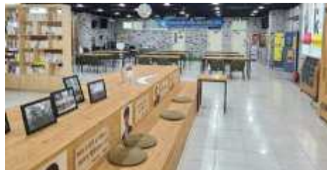
<창작 및 네트워크 연계 공간 청춘당>