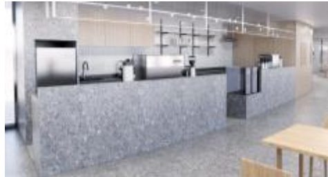
<리빙랩 내 공유주방>