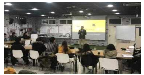
<청춘당 활용 외부 세미나 교육>