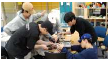
<디자인 팩토리 공간을 활용한 작업공간>