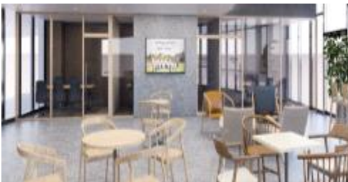
<리빙랩 내 회의공간>