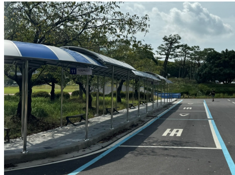
〈기존 시외버스 탑승 위치〉 대운동장 옆 통학버스 승강장