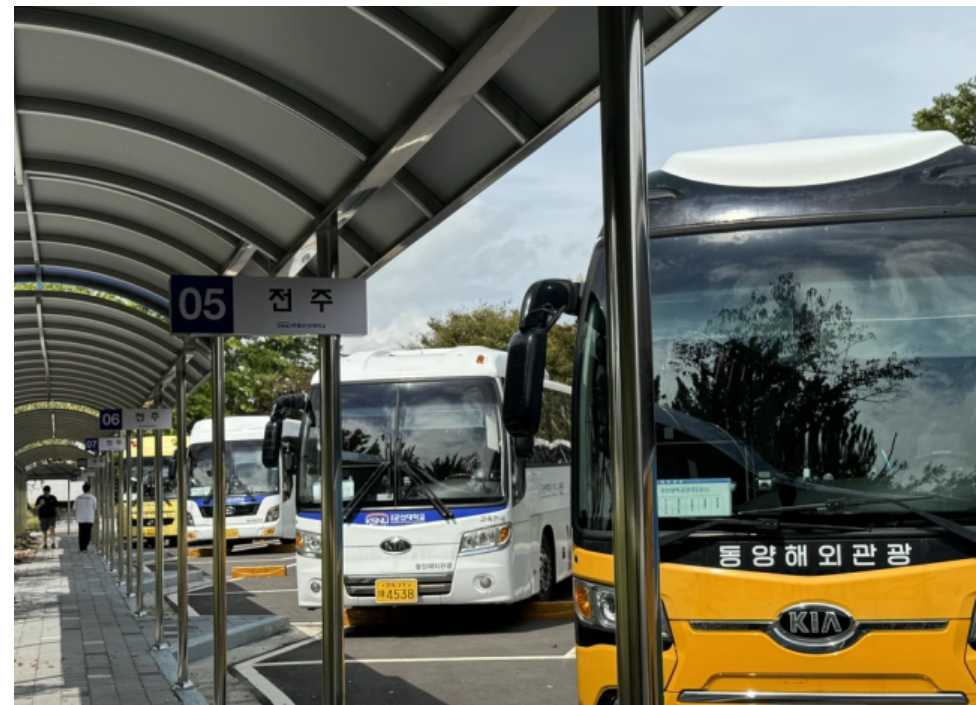
〈기존 통학버스 탑승 위치〉 대운동장 옆 통학버스 승강장