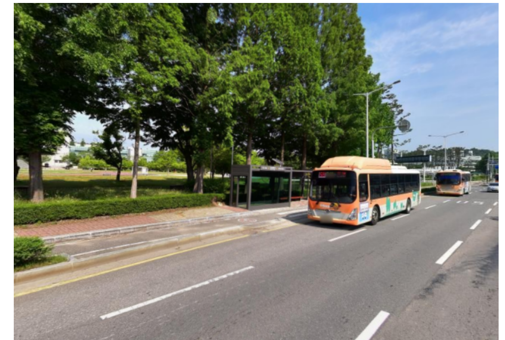
〈변경 후 탑승 위치〉 국립군산대 정문 버스정류장 앞