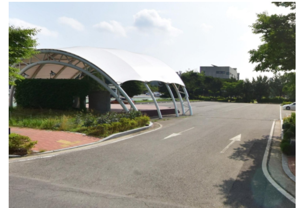
〈변경 후 탑승 위치〉 박물관 옆 노천극장 주차장