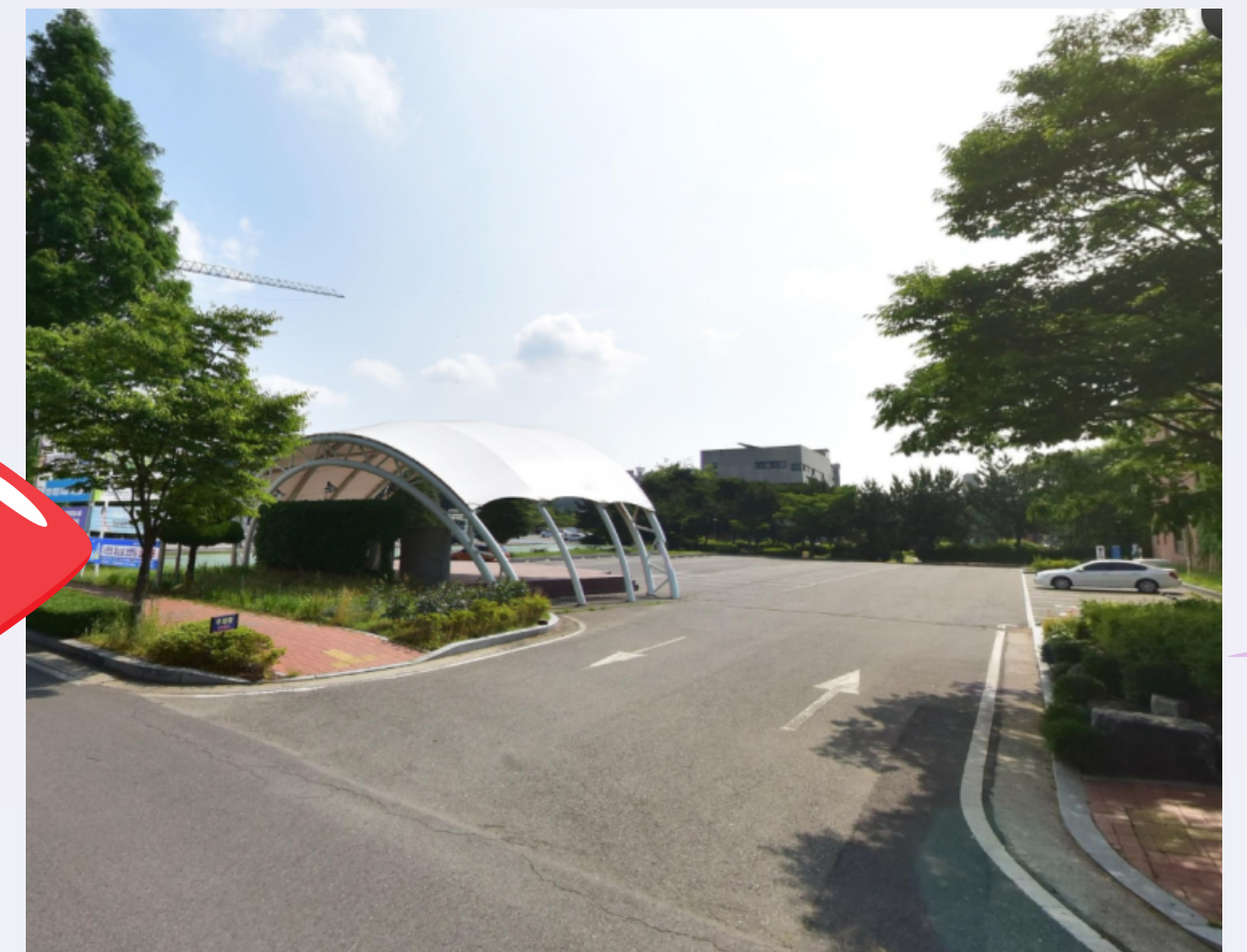
<변경 후 탑승 위치> 박물관 옆 노천극장 주차장