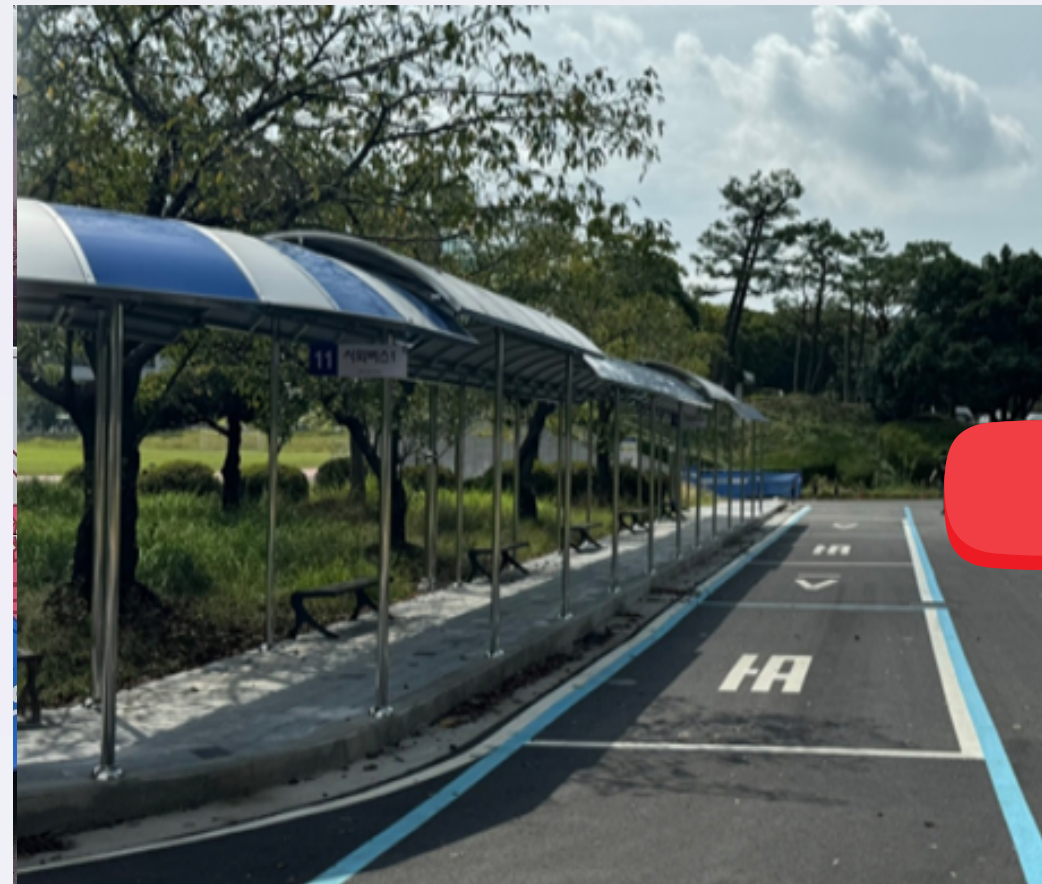
<기존 시외버스 탑승 위치> 대운동장 옆 시외버스 승강장