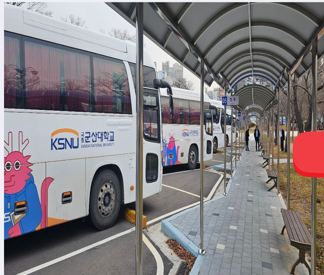
<기존 탑승 위치> 대운동장 옆 통학버스 승강장