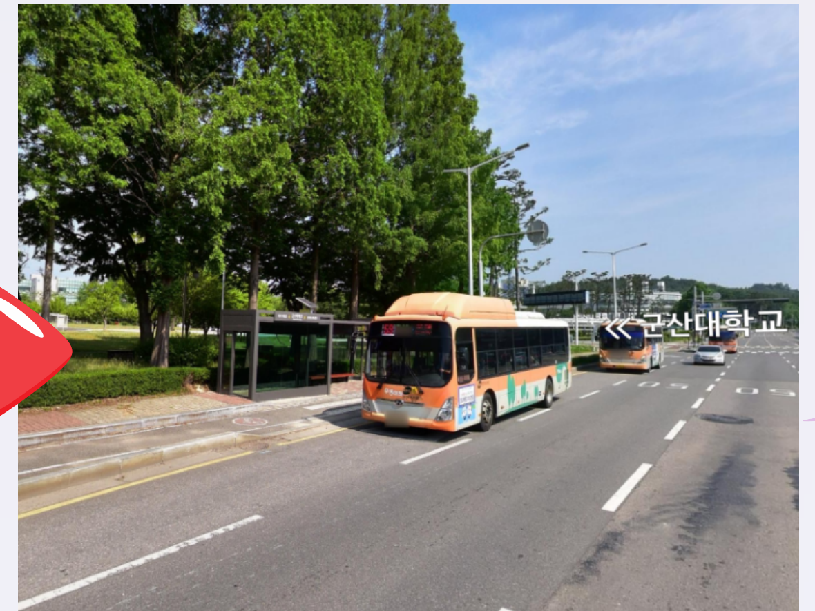
<변경 후 탑승 위치> 국립군산대 정문 버스정류장 앞