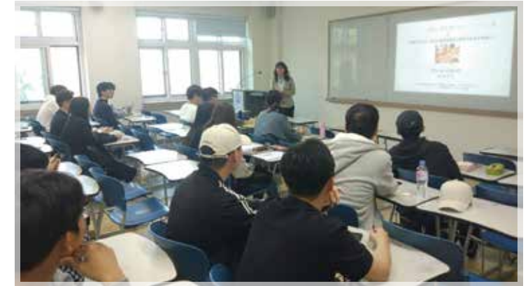
일본 간사이대학 교수초청 특강