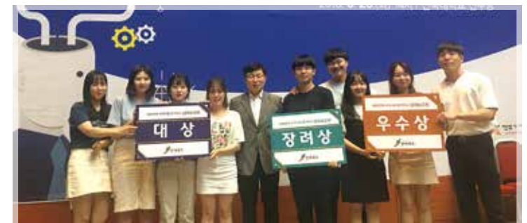
대학연계 지역사회 창의학교