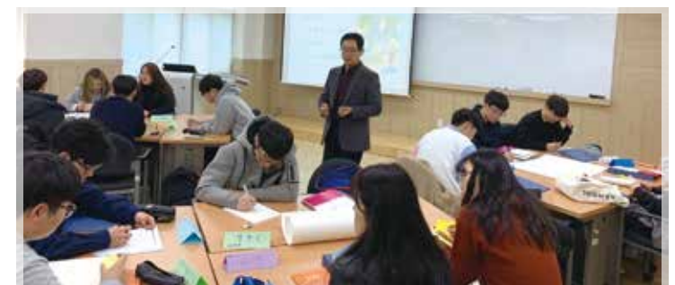
경제학과 페스티벌 졸업자 초청 강연