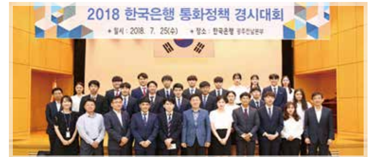
한국은행 통화정책 경시대회