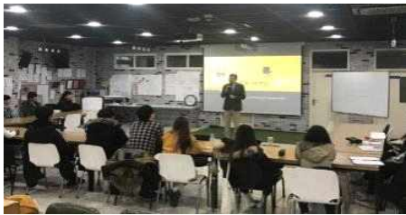
<청춘당 활용 외부 세미나 교육>

최첨단 시설의 학습·복합문화 공간인 도서관은 70여만 권의 장서와 10만여 종의 전자자료를 소장하고 맞춤형 학술 정보서비스를 제공하고 있는 중앙도서관과 이용자 중심의 학습패턴을 고려한 다양한 지식정보 공유의 협업 학습 공간으로 구성된 황룡도서관을 운영