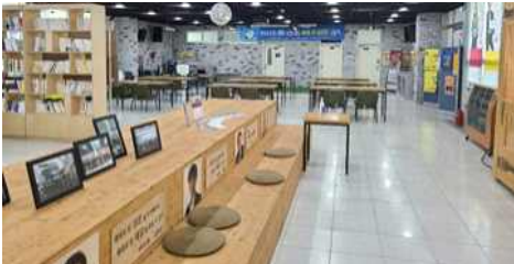
<창작 및 네트워크 연계 공간 청춘당>