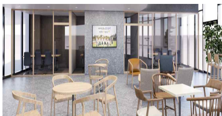
<리빙랩 내 회의공간>