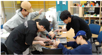
<디자인 팩토리 공간을 활용한 작업공간>