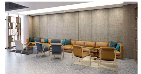
<리빙랩 내 소통공간>