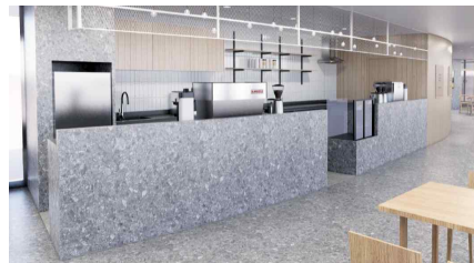
<리빙랩 내 공유주방>