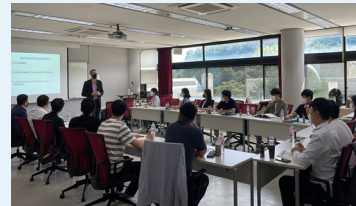
국제항로표지 연구 과정