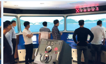
항로표지 선진화 과정