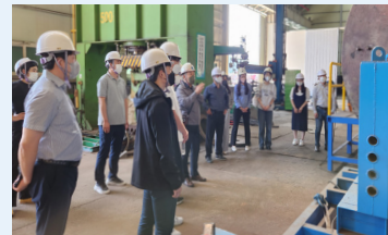
항로표지 기본 과정