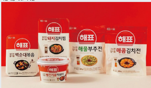
CU와 해표의 컬래버레이션 상품