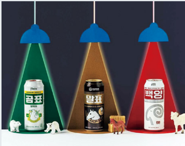
곰양말 맥주 시리즈