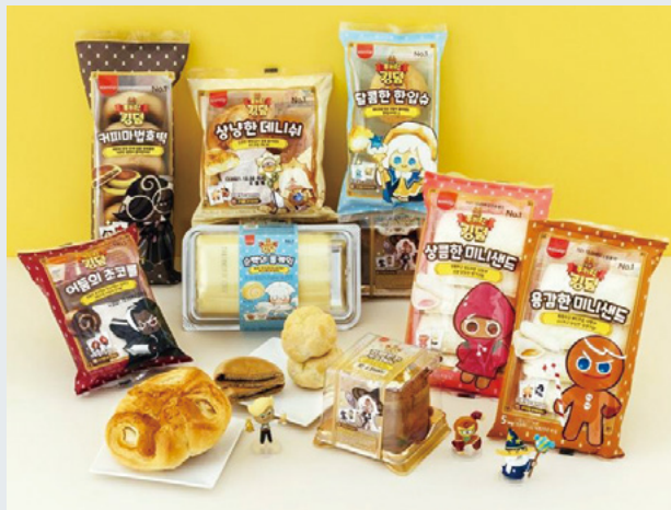
CU가 ‘쿠키런: 킹덤’과 협업한 상품