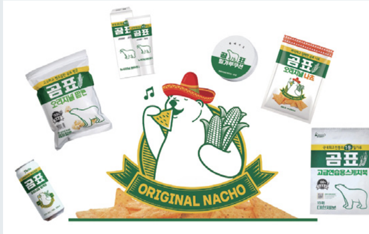
곰표의 컬래버레이션 상품 모음